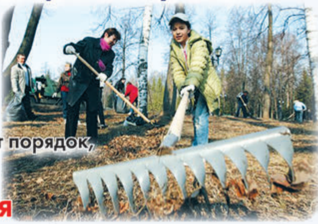
Администрация городского округа Самара