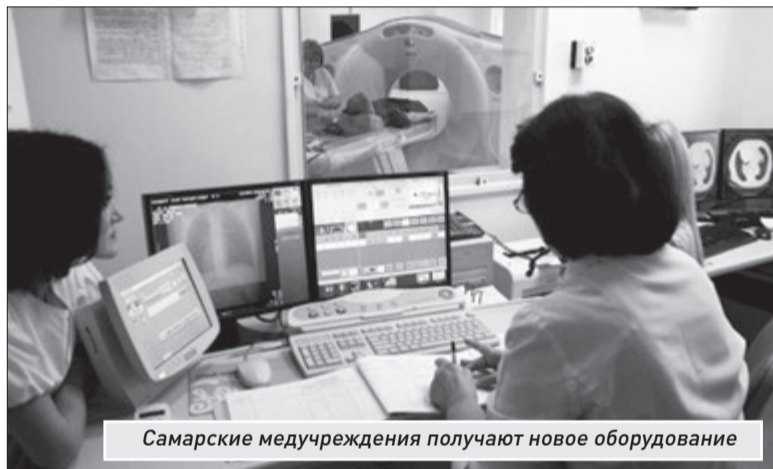
Самарские медучреждения получают новое оборудование

министр объяснил понижением сумм госконтрактов в ходе состоявшихся в минувшем году аукционов.