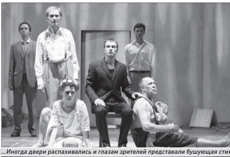
...Иногда двери распахивались и глазам зрителей представляли бушующая стихия, морские глубины или райское изобилие