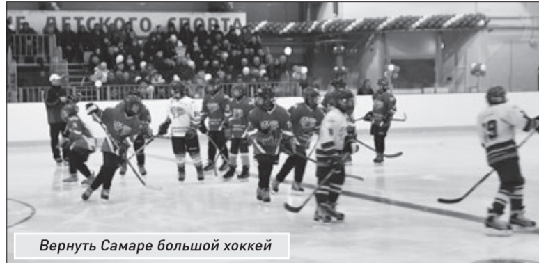
Вернуть Самаре большой хоккей

«Развитие физической культуры и спорта в Самарской области на 2010-2018 годы» в прошлом году было осуществлено 52 мероприятия, открыто 24 новых спортивных объекта (в т.ч. крытый каток в п. Мехзавод г.о. Самара). Всего потрачено 2,135 млрд рублей, что составило 83,2% от запланированного объема. Экономия средств