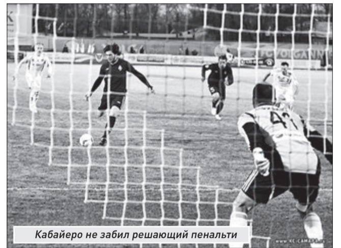
Кабайеро не забил решающий пенальти

«Волга» (Нижний Новгород) - «Крылья Советов» (Самара) - 1:1(1:0) 26 апреля. Нижний Новгород. Стадион «Локомотив»