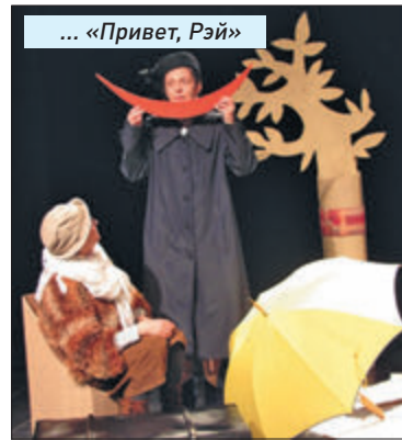
... «Привет, Рэй»