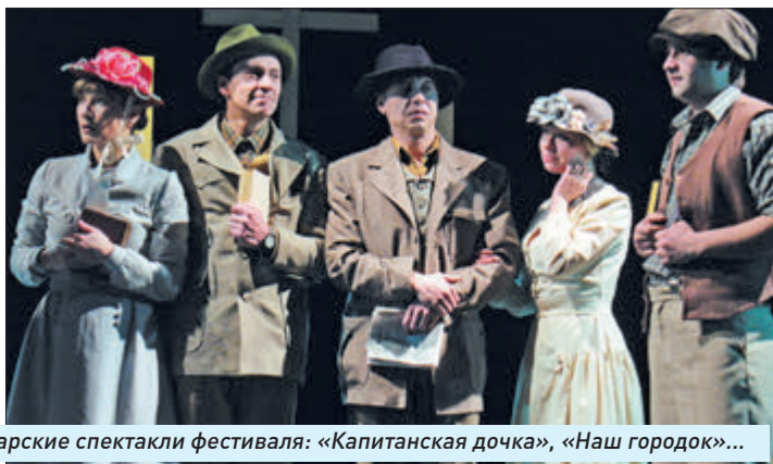
Самарские спектакли фестиваля: «Капитанская дочка», «Наш городок»...