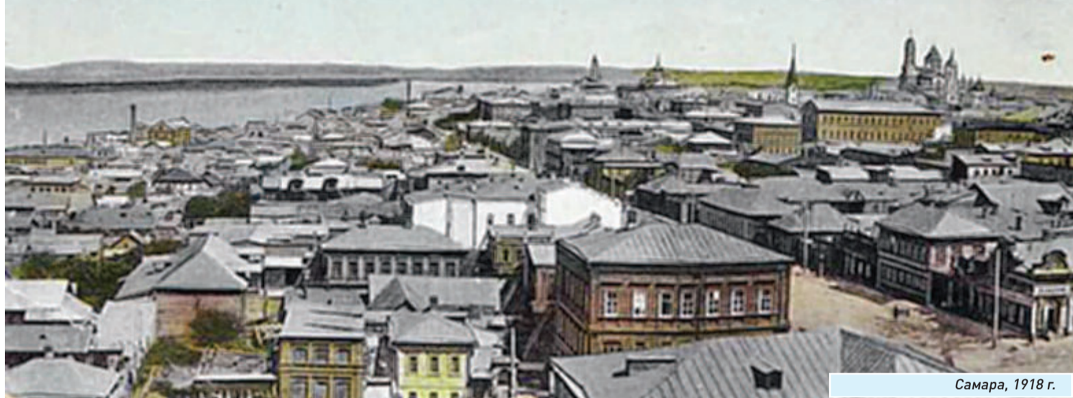
Самара, 1918 г.

Попытка расследования одной из загадок прошлого века