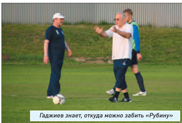
Гаджиев знает, откуда можно забить «Рубину»