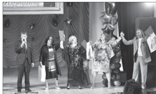
Торжественно отмечены сразу две знаменательные даты в новейшей истории Самары. Исполнилось 45 лет телестудии «Товарищ» (снимок сверху) и 15 лет народному детскому музыкально-хореографическому театру «Искорки», работающему на базе муниципального предприятия «Дворец торжеств» (ДК на площади имени С.М. Кирова). На снимке внизу сцена из премьерного спектакля «Славься, Русь Великая!»