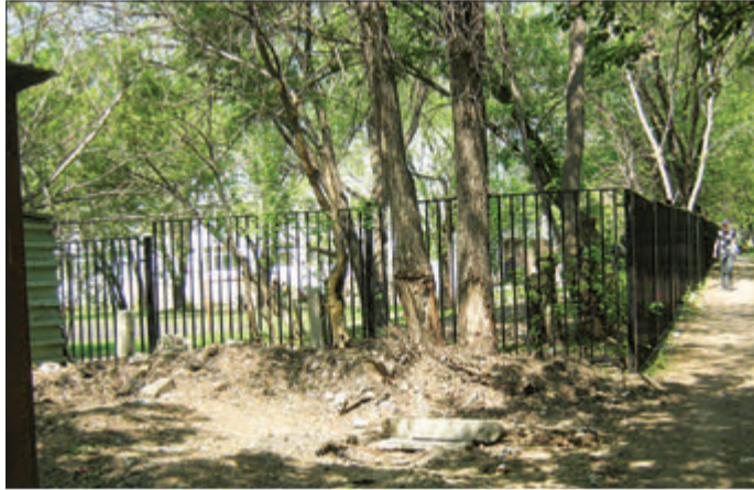
Ул. Партизанская, 78: стало чисто