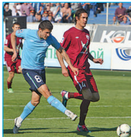
«Крылья Советов» уходят из опасной зоны