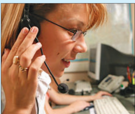
На каждый вопрос - ответ