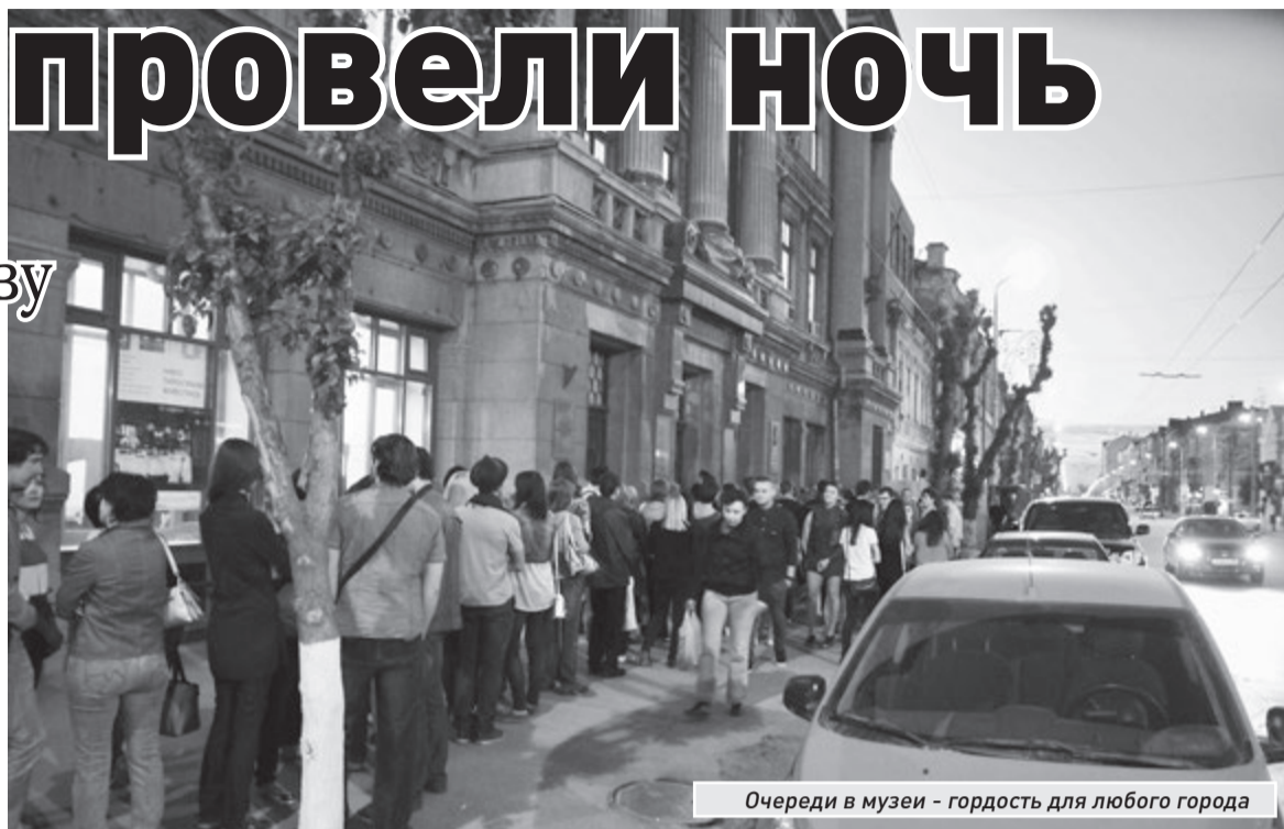
Очереди в музее - гордость для любого города

В течение следующего получаса посетители успели узнать, что в постоянной музейной экспозиции есть картины Айвазовского, и по-