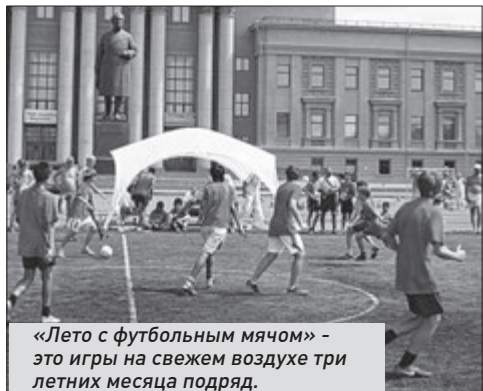
«Лето с футбольным мячом» - это игры на свежем воздухе три летних месяца подряд.