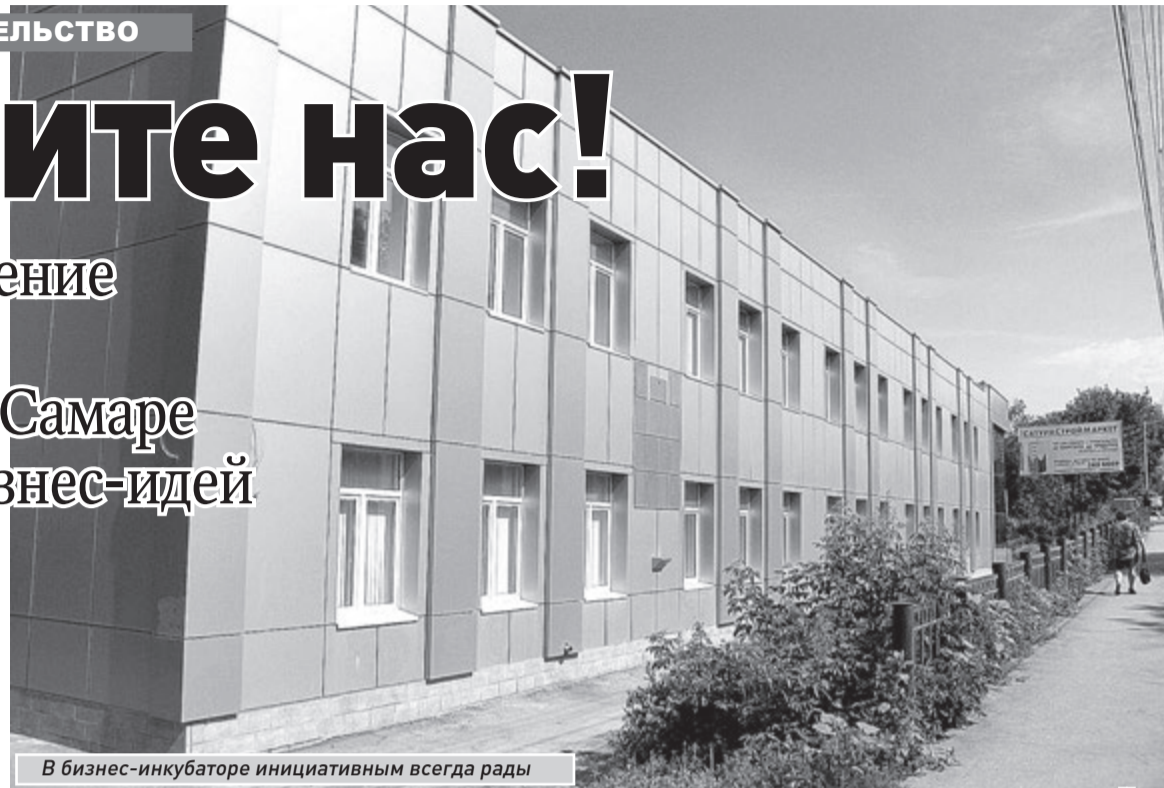
В бизнес-инкубаторе инициативным всегда рады

В попечительском совете конкурса в качестве наставников молодых предпринимателей участвовали 13 представителей различных сфер бизнеса, - рассказал председатель комитета по экономике Думы Вячеслав Кузин. - Участники финала получили специальные призы от членов попечительского совета. Это приглашения для участия в других конкурсах, сертификаты на услуги по оказанию помощи по ведению бизнеса, бесплатные консультации по минимизации налоговых выплат в информационно-консультационном центре при Палате налоговых консуль-