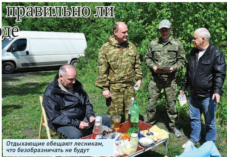
Отдыхающие обещают лесникам, что безобразничать не будут

В рамках ежегодной акции «Чистый лес» сотрудники лесничества, волонтеры, а также ученики школ убирают леса. Тем не менее привести в порядок огромные массивы невозможно - территория только Волжского лесничества около 30 тысяч га. Чистоту должны поддерживать сами люди. Если не соблюдать элементарные правила поведения в лесу, то гово-