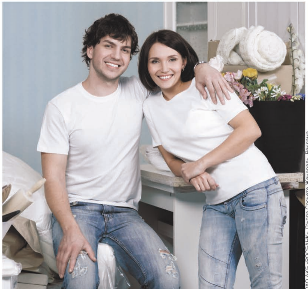
ОАО АКБ «РОСБАНК». Группа Сосьете Женераль. Реклама

Квартира, загородный жилой дом, земельный участок — выбирайте вместе с Росбанком!