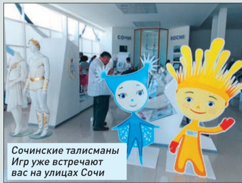
Сочинские талисманы Игр уже встречают вас на улицах Сочи

В 70-80 годы завод осуществлял поставки для грузовых канатных дорог на про-