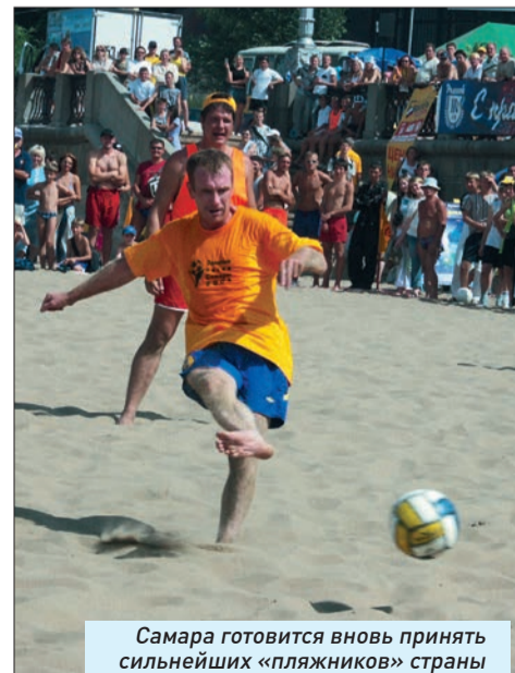
Самара готовится вновь принять сильнейших «пляжников» страны