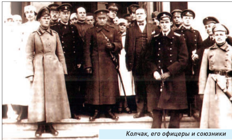
Колчак, его офицеры и союзники

Уже через два дня после взятия Казани, 12 сентября, с тяжелейшими боями армия Тухачевского возьмет Симбирск. Отличится «Железная дивизия» Гая Бжишкянца. «Железный Гай» отправит в Петроград историческую телеграмму раненому Ленину: «Взятие вашего родного города - это ответ за одну вашу рану, а за другую рану будет Самара!». Стоит добавить, Ленин был ранен эсеркой Каплан, правительство Комуча (как и Сибирского правительства, кстати) было эсеровским, а сами эсеры являлись заклятыми врагами большевиков. Борьба между двумя революци-