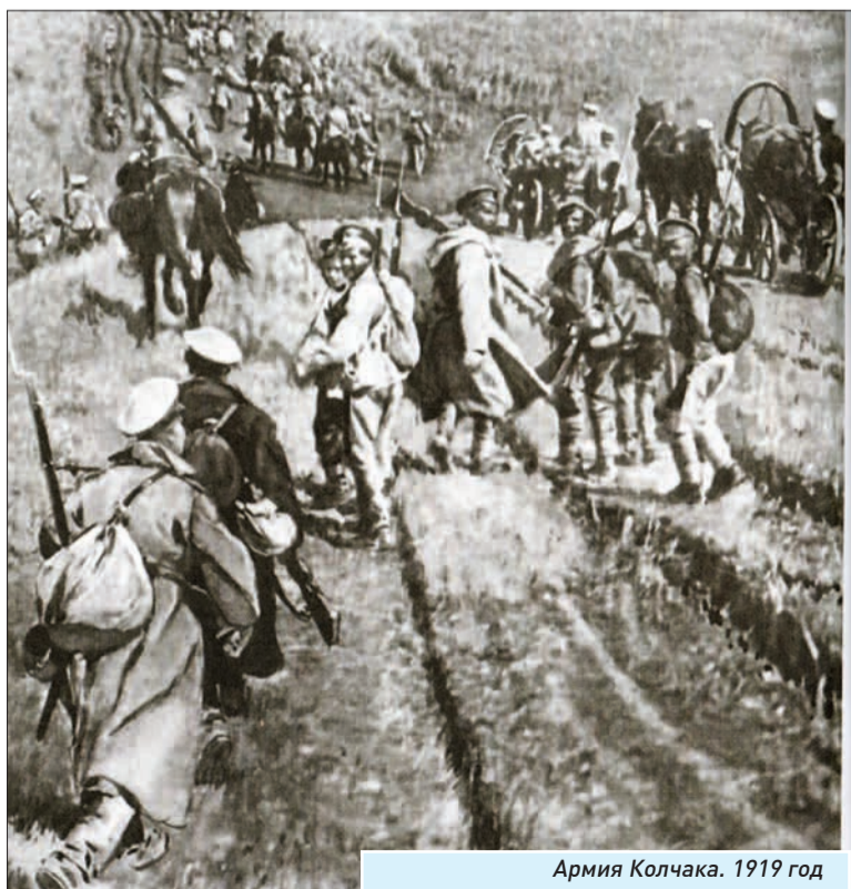
Армия Колчака. 1919 год