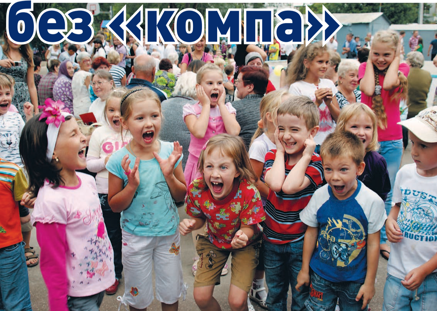
ЕКАТЕРИНА ЕЛИЗАРОВА (ФОТО ИЗ АРХИВА)

Завтра, в День защиты детей, на площади имени Куйбышева состоится необычная семейная игротека