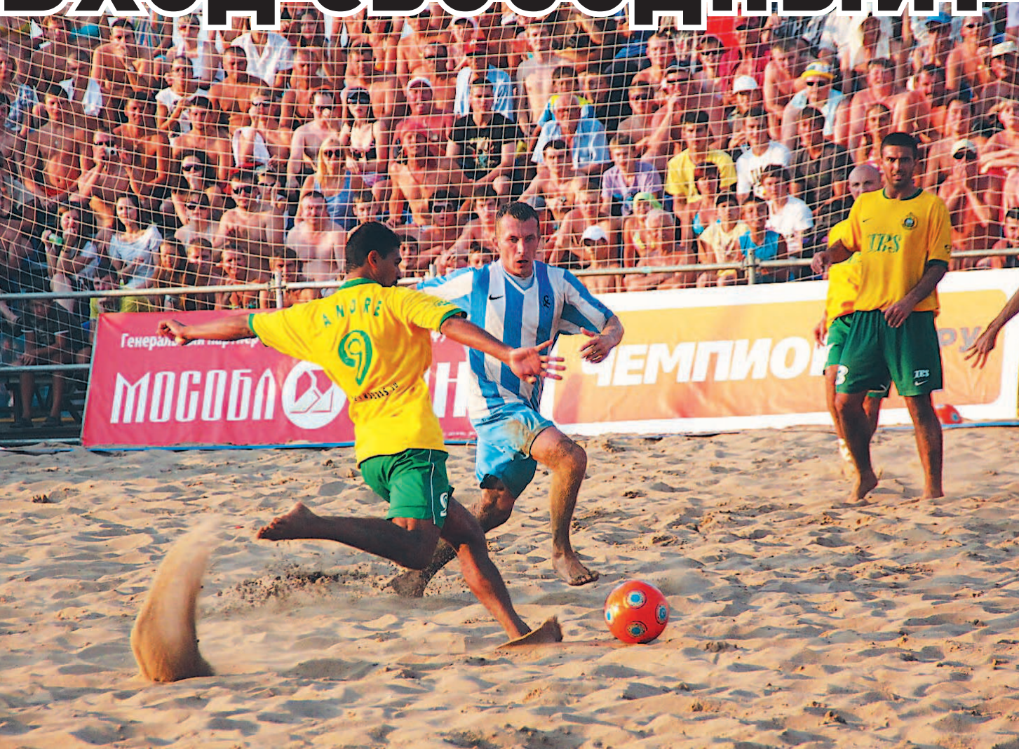
ВЛАДИМИР ПЕРЬЯКОВ

Сегодня в Самаре стартует второй этап чемпионата России по пляжному футболу