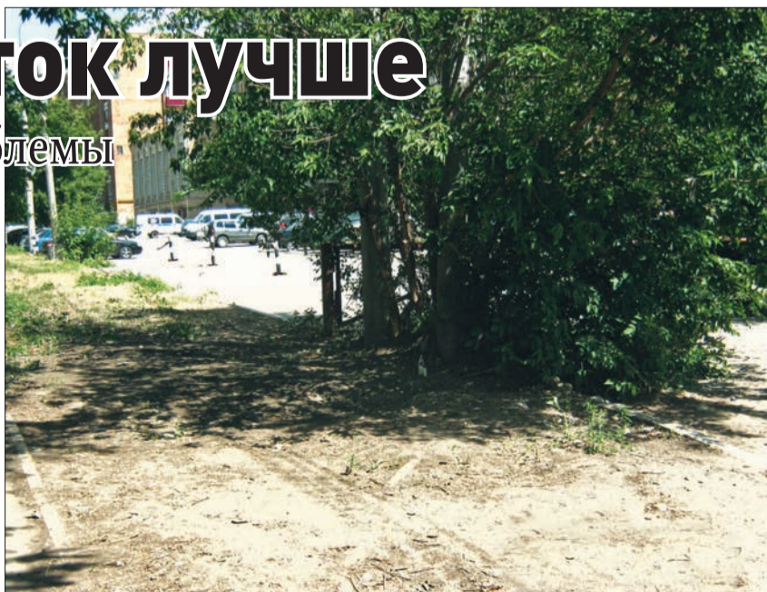
Подготовила Алена СЕМЕНОВА

К счастью, ситуацию исправили достаточно быстро. Городская административно-техническая инспекция вовремя заметила беспорядок и поручила убрать сухие ветки и сучья. Территорию расчистили. Теперь здесь относительный порядок.