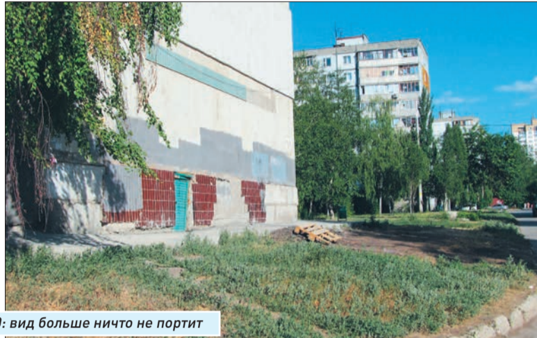
Улица Тополей, 20: вид больше ничто не портит