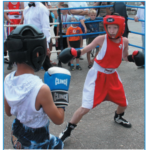
Самаре - новый спортивный проект СТР. 5

курс валют сегодня Центробанк РФ | $ 32.54 | € 42.59 | погода на завтра gismeteo.ru | День | +26 | небольшой дождь, ветер С-З, 4 м/с | давление 744, влажность 62% | Ночь | +19 | ясно, ветер З, 1 м/с | давление 743, влажность 95%