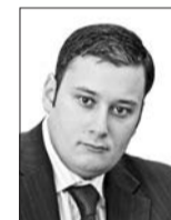
АЛЕКСАНДР ХИНШЕЙН депутат Государственной Думы РФ:

потому что лидером партии Владимиром Путиным была оказана беспрецедентная помощь АвтоВАЗу, а следовательно, всей Самарской области. Очень важно, что это не столько площадка для соревнования, сколько место для высказывания идей и появления новых лидеров. Здесь много людей, представляющих разные слои населения и общественные организации. Они уже становятся активными участниками политического процесса, и главная идея Народного фронта именно здесь начинает претворяться в жизнь.