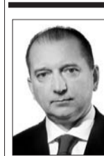
ВЛАДИМИР АРТЯКОВ губернатор Самарской области:

– У нас сегодня динамично развиваются все ключевые отрасли экономики. В первую очередь это предприятия химической промышленности, нефтяная отрасль, авиакосмический комплекс, двигателестроение. Особое внимание уделяется малому и среднему бизнесу: 26 тыс. предпринимателей получили в прошлом году разного рода господдержку. Это касается и Тольятти. Принята целевая программа по поддержке и развитию малого и среднего предпринимательства города до 2015 года. У нас есть сегодня все, чтобы сделать Тольятти еще более современным, успешным, красивым мегаполисом.