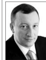
АЛЕКСАНДР ФЕТИСОВ секретарь регполитсовета партии «Единая Россия»:

– У нас сегодня динамично развиваются все ключевые отрасли экономики. В первую очередь это предприятия химической промышленности, нефтяная отрасль, авиакосмический комплекс, двигателестроение. Особое внимание уделяется малому и среднему бизнесу: 26 тыс. предпринимателей получили в прошлом году разного рода господдержку. Это касается и Тольятти. Принята целевая программа по поддержке и развитию малого и среднего предпринимательства города до 2015 года. У нас есть сегодня все, чтобы сделать Тольятти еще более современным, успешным, красивым мегаполисом.