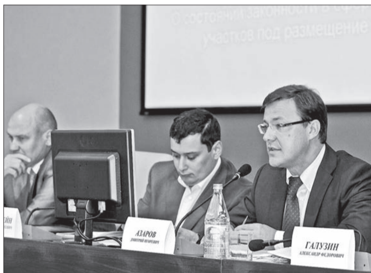
БОРЬБА с незаконными киосками – один из приоритетов деятельности мэрии Самары в этом году

Прокурор Самарской области Юрий Денисов уверен, что очистку города от незаконных ларьков можно закончить в течение этого года. Для этого требуется скоординировать действия правоохранительных органов, муниципальных и региональных властей. Прокурор рекомендовал областному министерству имущественных отношений (именно это ведомство заключает договоры на предоставление земельных участков) в течение августа провести ревизию всех договоров, заключенных с коммерсантами. Ведь даже те объекты, которые имеют договоры аренды и формально являются законными, зачастую установлены с наруше-