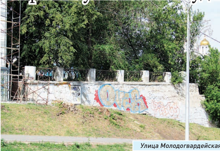
Улица Молодогвардейская, 218: очистили от граффити

| Борьба с уличными «художествами» продолжается