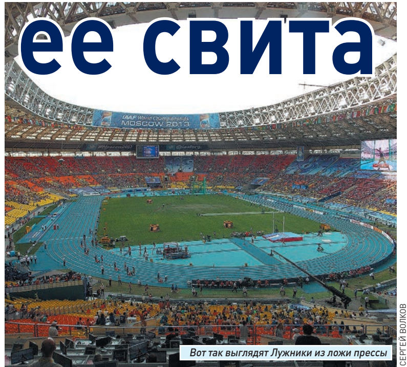
Вот так выглядят Лужники из ложи прессы