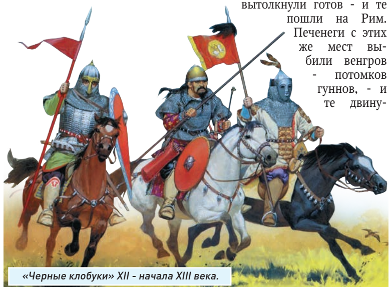
«Черные клобуки» XII - начала XIII века.