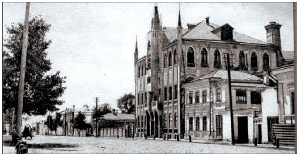
УЛИЦА КАЗАНСКАЯ в начале XX века

Во время Великой Отечественной войны в бывшем особняке располагался госпиталь, в 60-70-е годы здесь находилась гостиница КЭЧ ПриВО. Затем дом принадлежал заводу имени Масленникова. К сожалению, в настоящее время здание находится в аварийном состоянии и потихоньку разрушается. ◀