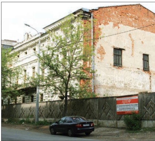
ТАК СЕГОДНЯ выглядит особняк Субботиных-Шихобаловых