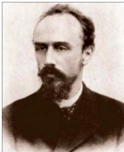
ГУБЕРНАТОР И.Л.Блок, погибший от руки террориста

Шихобалов произвел реконструкцию здания, при которой, к сожалению, дом побелили, слегка разрушив задумку его создателя. Новые хозяева купцы Шихобаловы сдавали бывший субботинский особняк разным предпринятиям. А с 1906 по 1910 годы здесь была резиденция самарских губернаторов.