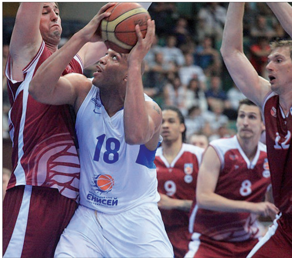
«ЕНИСЕЙ» готов испортить завтра настроение самарским поклонникам баскетбола. Готовы ли «Крылья» его улучшить?