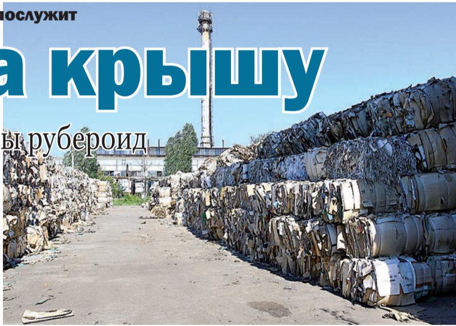
НОВЫМИ КРЫШАМИ скоро станет эта гора макулатуры