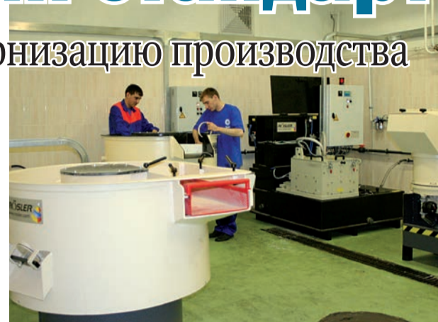
БУДУЩЕЕ за новациями

само количество стоков за счет замкнутой системы циркуляции технологической жидкости, но и сказывается на их качестве. Подчеркнем: оборудование соответствует европейским стандартам экологии. Немецкие машины и материалы являются безопасными для окружающей среды и человека, что подтверждено рядом соответствующих сертификатов – DIN EN ISO 14001 и DIN EN ISO 9001.