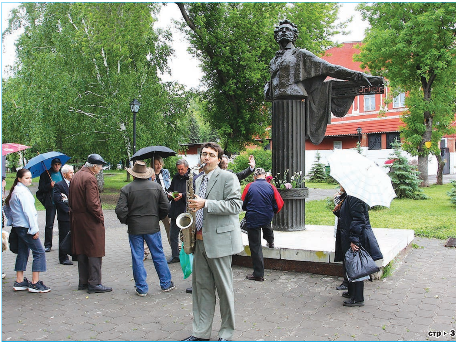
стр ► 3

► Самарцы вспоминали творчество Александра Сергеевича