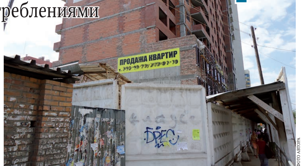
«НАГЛЯДНОЕ ПОСОБИЕ» - дом на пересечении улиц Полевой и Арцыбушевской. Внимание! Пользуйтесь информацией только с официального щита строителя

Как же избежать такой ситуации? Во-первых, где-то недалеко от въезда на стройплощадку должен быть щит с описанием объекта. Там, помимо информации о самом доме, должны быть и данные о застройщике или заказчике, в частности - их телефоны. Даже если нет телефонов, не беда, их можно узнать по справке. Вот к застройщику (заказчику) и надо обратиться