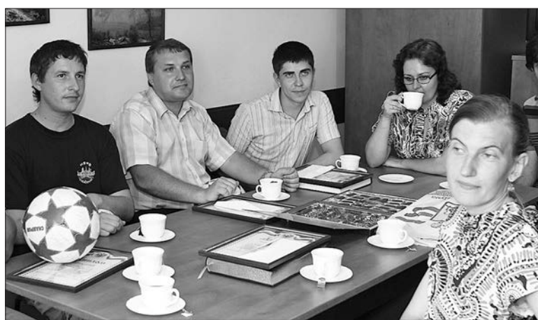
НАСТОЯЩЕЕ самарского футбола стало главной темой разговора призеров за чашкой чая