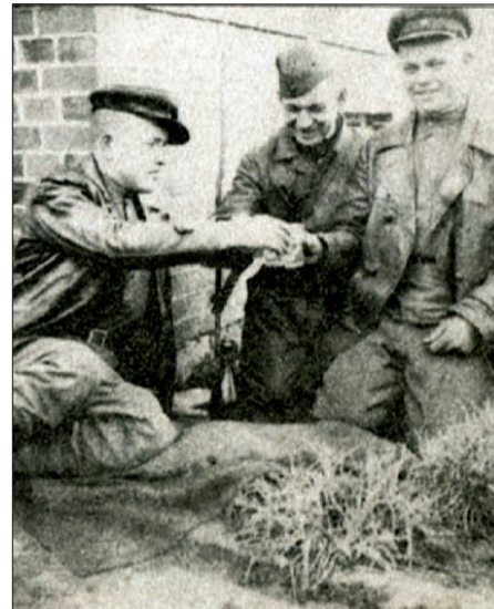
Подготовила Наталья БЕЛОВА

А на фронт попал, когда мне исполнилось 18 лет и меня в марте 42 года призвали в армию. Окончил курсы радиотелефонистов в Куйбышеве, а летом — уже на фронт, под Москву. Тяжелые бои нас ждали под Ржевом, я был радистом в составе экипажа танка. Тогда, если правду сказать, нам здорово досталось... Дошел до Берлина. Осталась даже фотография, где 2 мая мы празднуем с однополчанами Победу.