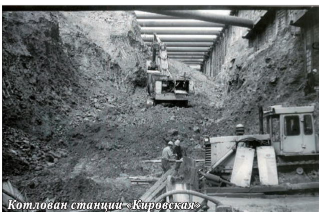
Котлован станции «Кировская»

Самарское метро начинает работу в 6 утра, а в 12 ночи вестибюли закрывают для прохода пассажиров. Когда составы уходят в депо, в тоннелях с контактного рельса снимают напряжение в 825 вольт — весьма опасное для жизни. Сюда спускаются ремонтники: проверяют техническое состояние путей. Специальный поезд убирает тоннели. Утром напряжение пода-