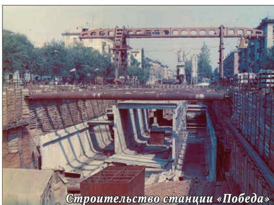
Строительство станции «Победа»