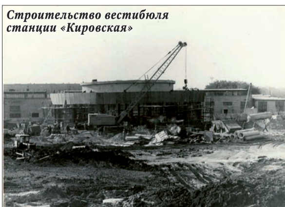
Строительство вестибюля станции «Кировская»