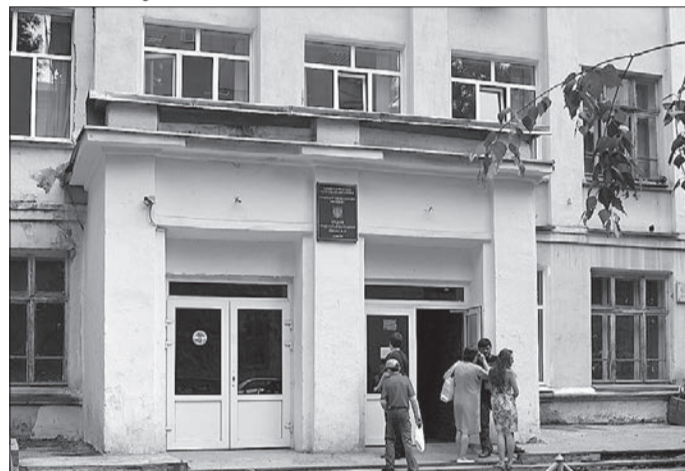
Иван СМЕРНОВ отдел муниципальной жизни

▶ В случае сноса СОШ № 81 отстроят на прежнем месте