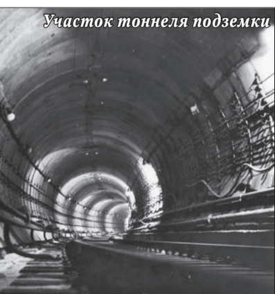
Участок тоннеля подземки