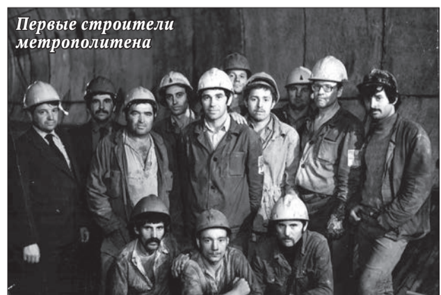
Первые строители метрополитена