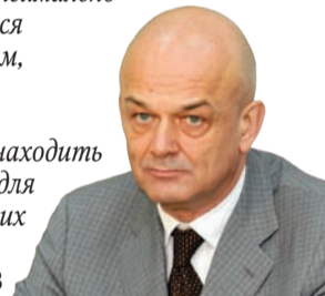
Юрий РИМЕР первый заместитель главы г. о. Самара