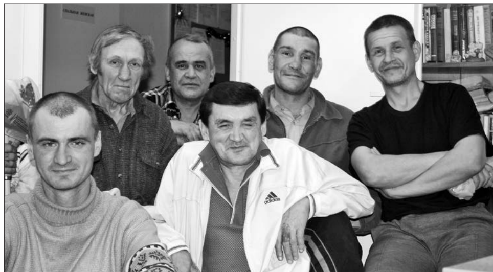
ПОСТЯЙЛЬЦЫ Крайней улицы