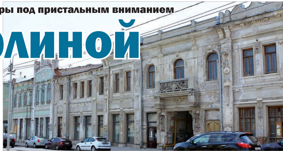
ОСОБНЯК купца Шихобалова преобразится

«К сожалению, темпы реконструкции слишком медленные. Но если к 2012 году работы завершатся - будет просто замечательно. То же могу сказать про особняк Шихо-