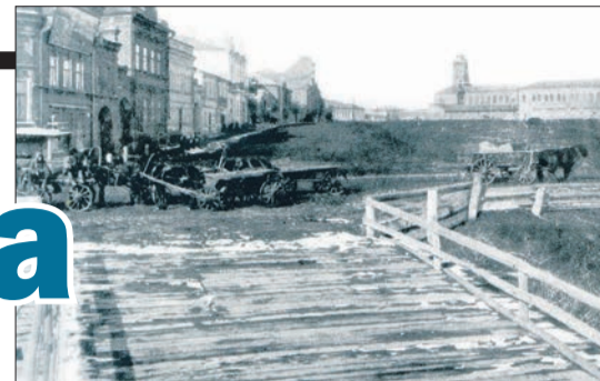
ХЛЕБНАЯ ПЛОЩАДЬ со стороны реки Самары в начале XX века