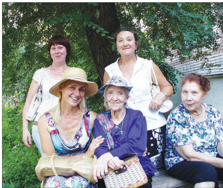
РАДОСТНАЯ ВСТРЕЧА у подъезда дома

Во время этого визита в квартиру мы заметили в ней некоторые изменения. Вернее, новые декорации. На видном месте появился