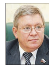
Александр ТОРШИН первый заместитель председателя Совета Федерации:

- Не надо конкретизировать, какое оружие - боевое, охотничье, травматическое. Я считаю, что право на ношение оружия должно быть у всех, кто достиг 18 лет. Речь идет исключительно о законопослушных российских гражданах, именно они должны иметь это право. И еще один важный аспект - ситуация с женщинами. Они тоже должны иметь это право, хотя в армии и не служат.