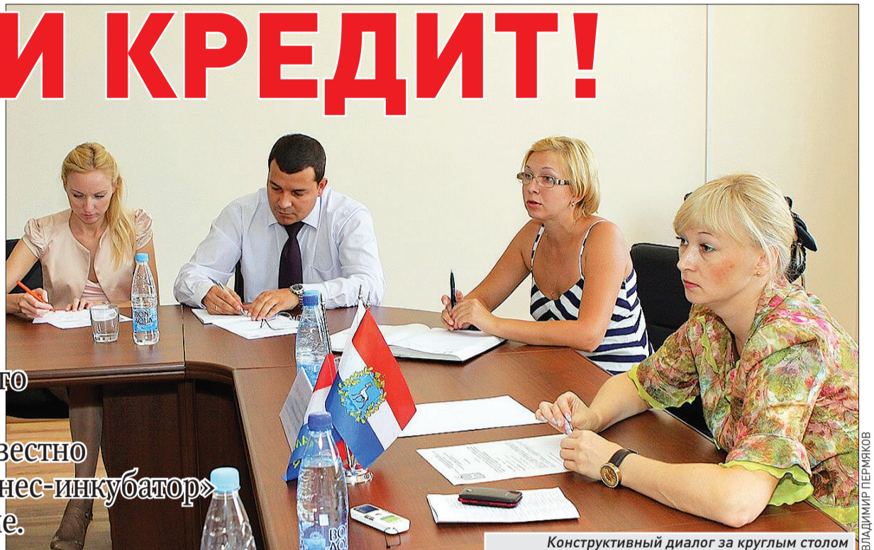
Конструктивный диалог за круглым столом

Субсидирование процентных ставок по кредитованию для субъектов малого и среднего бизнеса станет доступнее предпринимателям. Об этом стало известно на прошедшем в МП «Самарский бизнес-инкубатор» круглом столе, посвященном этой теме.