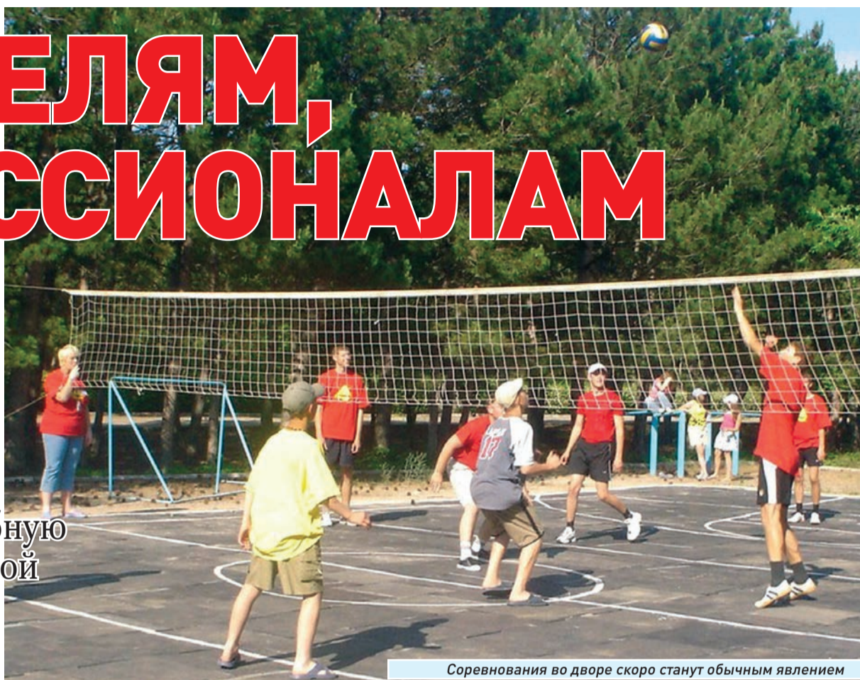
Соревнования во дворе скоро станут обычным явлением

Муниципалитет принял масштабную целевую программу по физической культуре и спорту, рассчитанную на 2011-2015 годы