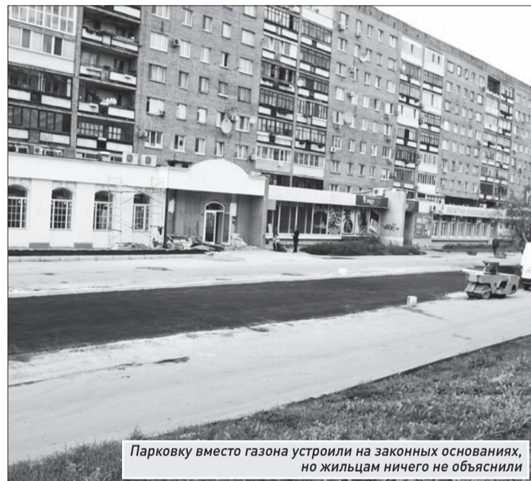
Парковку вместо газона устроили на законных основаниях, но жильцам ничего не объяснили

«То, что люди пишут в твиттере, они пишут для всех, - заявил Дмитрий Азаров. - Здесь каждый