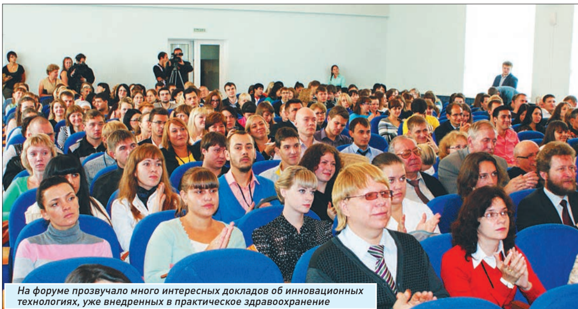
На форуме прозвучало много интересных докладов об инновационных технологиях, уже внедренных в практическое здравоохранение