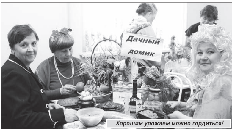
Хорошим урожаем можно гордиться!