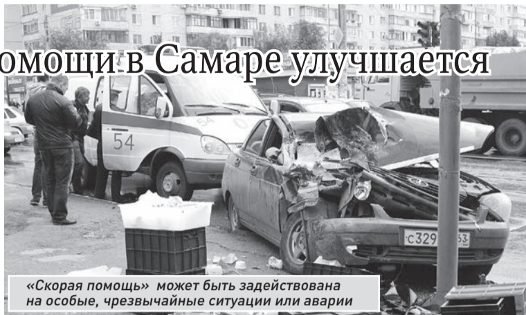
«Скорая помощь» может быть задействована на особые, чрезвычайные ситуации или аварии

Но проблема, по словам Мокшина, в том, что поликлиникам это невыгодно: «Сейчас, если в «скорой помощи» вызов стоит более 1500 руб., то на «неотложную помощь» в преискуртанте предусмотрено всего 330 руб.». - На прошлой неделе мы