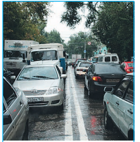
Транспортный коллапс стр. 6