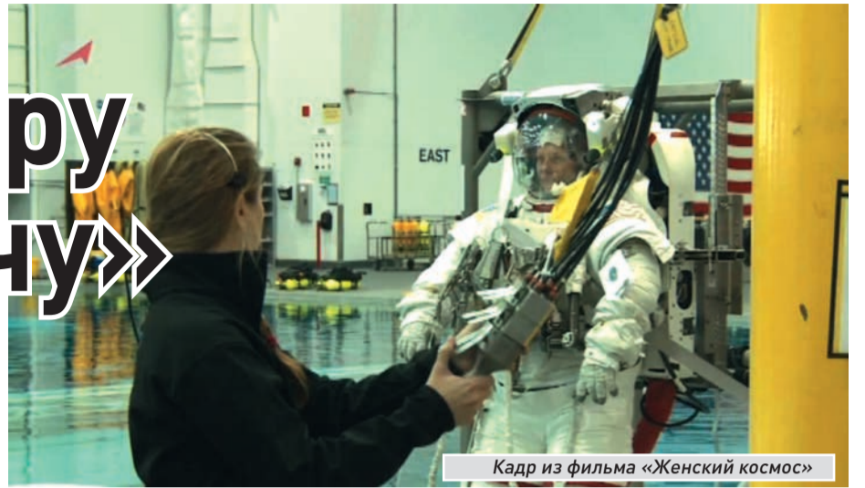
Кадр из фильма «Женский космос»