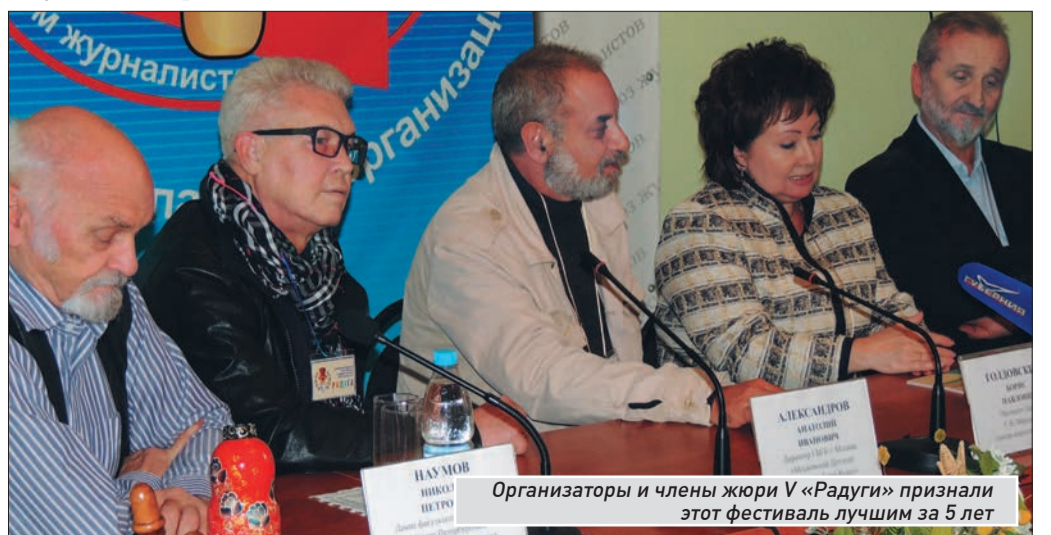
Организаторы и члены жюри V «Радуги» признали этот фестиваль лучшим за 5 лет

С расписанием фестиваля «Радуга» можно ознакомиться на сайте samarapurpet.ru и в помещении Самарского театра кукол (ул. Льва Толстого, 82, тел. 332-08-24).