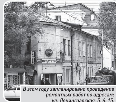
В этом году запланировано проведение ремонтных работ по адресам: ул. Ленинградская, 5, 6, 15.

543 объектов потребительского рынка, расположенных в зданиях.