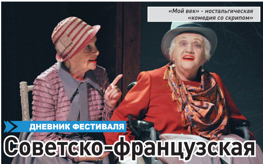
«Мой век» - ностальгическая комедия со скрипом

Елена Санаева уже в третий раз является почетным гостем и членом жюри Самарского фестиваля «Соль земли». Но и в советские времена она бывала в нашем городе частым гостем. В одну из таких поездок, кстати, и получила запомнившийся на всю жизнь урок мастерства от мужа Ролана Быкова : в каком-то «красном уголке», где и было-то всего человек семь зрителей, знаменитый артист по полной программе отыграл свой творческий вечер. Сама Елена Санаева сегодня является автором уже пяти документальных фильмов, героями которых, помимо Быкова, стали фотограф Юрий Рост и режиссер Алексей Герман .