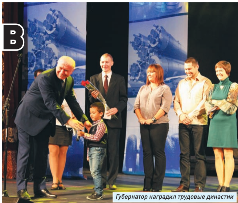
Губернатор награждает трудовые династии

Особое значение в этом свете приобретает развитие цепочки «школа - вуз - предприятие». Именно поэтому в этот день наравне с сотрудниками промышленных предприятий чествовали