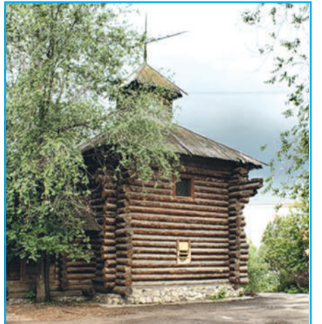
«Отсюда пошла Самара»