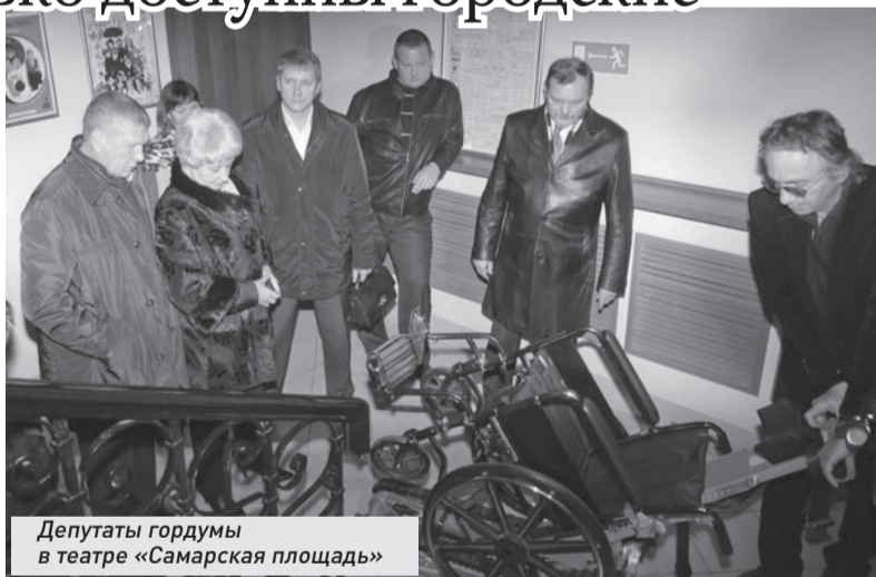
Депутаты гордумы в театре «Самарская площадь»