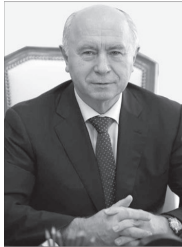
Губернатор Самарской области Николай Меркушкин.

В понедельник губернатор Самарской области Николай Меркушкин встретился с первым заместителем руководителя администрации Президента России Вячеславом Володиным. На встрече обсуждалась общественно-политическая обстановка в регионе. В частности, губернатор и первый заместитель руководителя администрации Президента обсудили итоги выборов, прошедших в Самарской области 8 сентября.