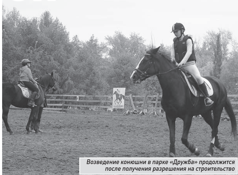
Возведение конюшни в парке «Дружба» продолжится после получения разрешения на строительство

От департамента строительства и архитектуры за клубом будут закреплены кураторы, которые помогут подготовить документы, связанные с выделением земельного участка, проконсуль-