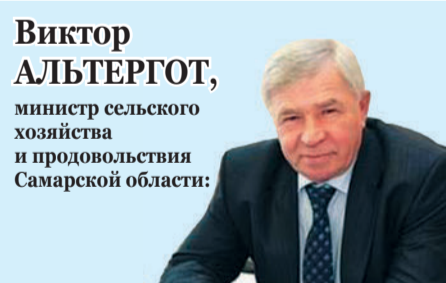
Виктор АЛЬТЕРГОТ, министр сельского хозяйства и продовольствия Самарской области: