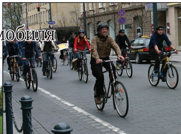
За границей такая картина привычна

того везет. Тупик развития массового автомобилепользования в городах, то есть использования машин для поездок на работу внутри города (не путать с автомобилизацией – числом купленных автомобилей на 1000 жителей!), стал очевиден и правительству, и общественности. В Европе это поняли гораздо раньше, чем в России. Поэтому там уже никого не удивить выделенными полосами общественного транспорта, велодорожками, окутывающими весь город, или даже платным въездом в отдельные районы.