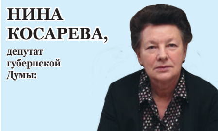
НИНА КОСАРЕВА, депутат губернской Думы: