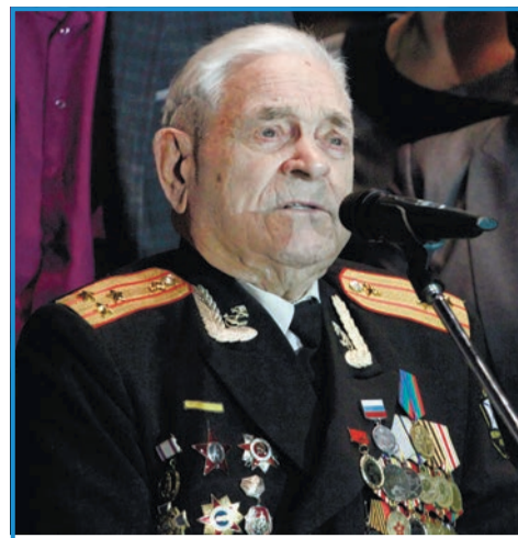
Триумфальная арка для героев Победы