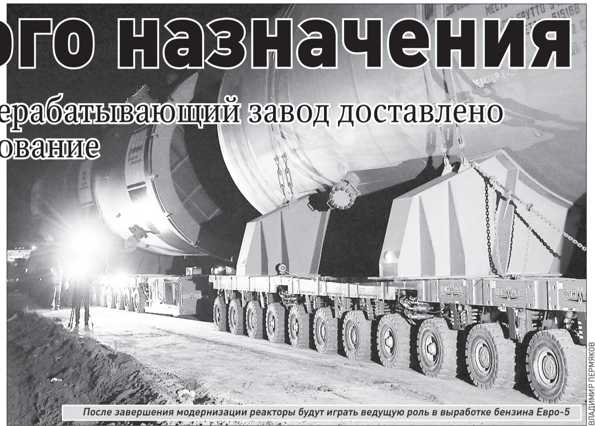
После завершения модернизации реакторы будут играть ведущую роль в выработке бензина Евро-5

Прибытие реакторов - завершающий этап крупномасштаб-