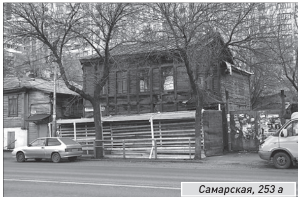
Самарская, 253 а