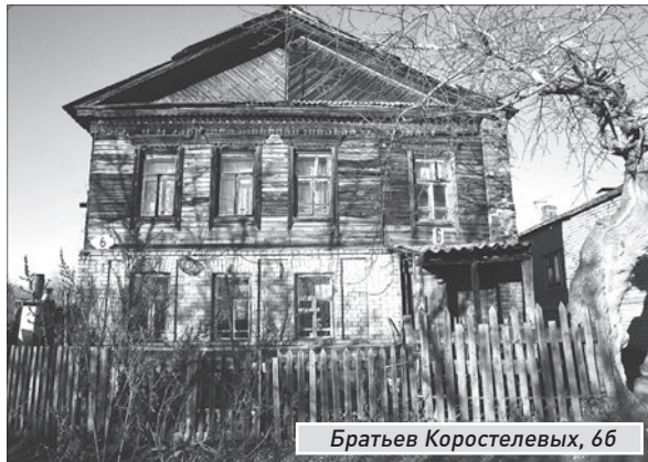
Братьев Коростелевых, 66