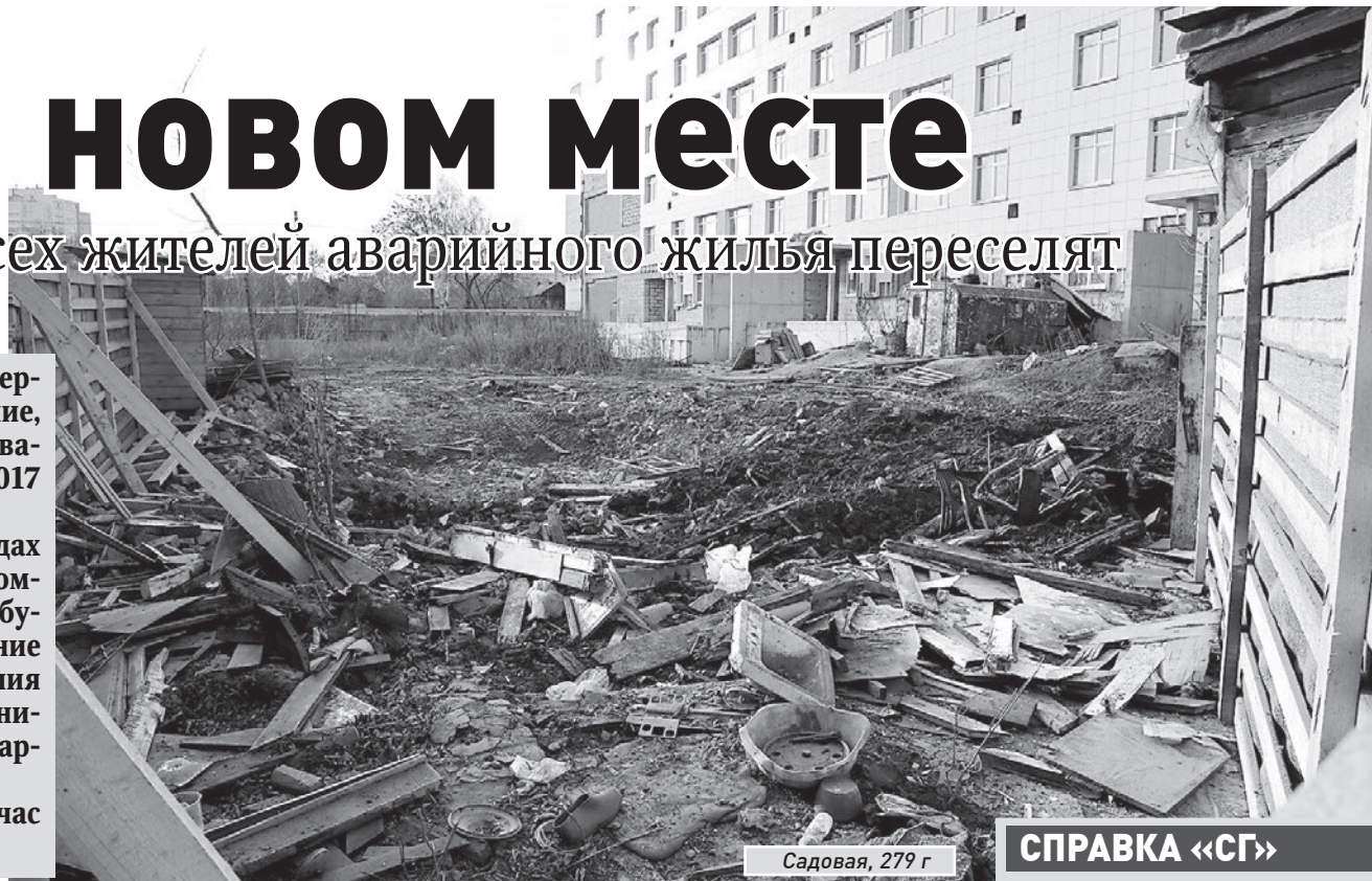
Садовая, 279 г

«Сегодня аварийными надлежанием образом признано около 300 домов, - рассказывает Виктор Федоренчик. - Ситуация серьезная, мы это прекрасно понимаем, но действовать можем только в рамках правового законодательства и финансирования, заложенного в целевые программы по переселению. Те средства, которые выделяются на покупку нового благоустроенного жилья, используются по назначению, и граждане в порядке очереди переезжают».