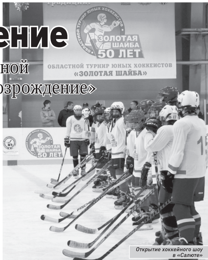
Открытие хоккейного шоу в «Салюте»

Всего с 10 января по 6 марта «Крылья Советов» проведут 14 контрольных игр. Три матча «Крылья» проведут на первом сборе, еще два - на турнире в Гонконге. Самым насыщенным в игровом плане будет второй сбор, где запланировано семь игр, а на заключительном этапе подготовки, который продлится около недели, команда проведет две встречи.