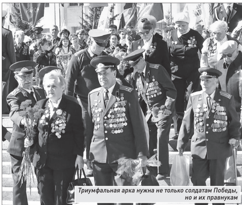
Триумфальная арка нужна не только солдатам Победы, но и их правнукам

Мемориальным сооружением в честь 70-летия Победы могла бы стать триумфальная арка. Дмитрий Азаров это предложение