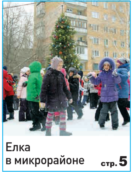
Елка в микрорайоне стр. 5

курс валют сегодня Центробанк РФ $ 32.62 | €44.65 | погода на завтра gismeteo.ru День -7 | пасмурно, ветер Ю, 2 м/с | давление 762 влажность 95% | Ночь -6 | неб. снег ветер Ю-З, 2 м/с | давление 763 влажность 94%