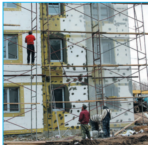
Азбука капремонта стр. 6

курс валют сегодня Центробанк РФ | $ 32.64 | € 44.64 | погода на завтра gismeteo.ru | День | -4 | пасмурно ветер Ю-З, 2 м/с | давление 764 влажность 93% | Ночь | -8 | малооблачно ветер Ю, 3 м/с | давление 764 влажность 93%