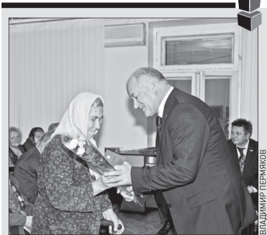
➤ Председатель губернской Думы Виктор Сазонов вручает медали ветеранам — участникам Парада памяти, который пройдет 7 ноября 2011 года.