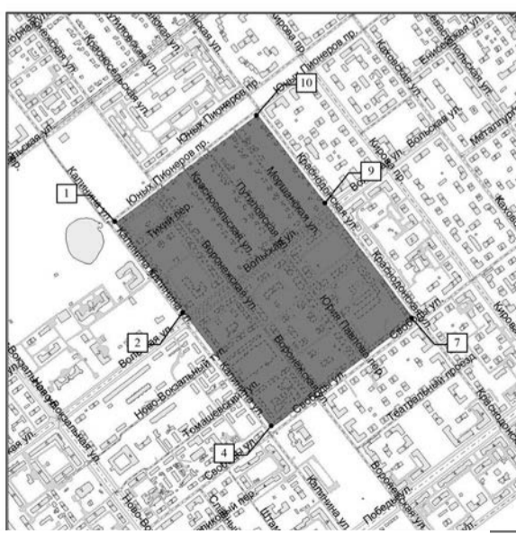
М 1:10000 ПРИМЕЧАНИЕ: 1. Графический материал действителен только для подготовки распоряжения на проектирование.