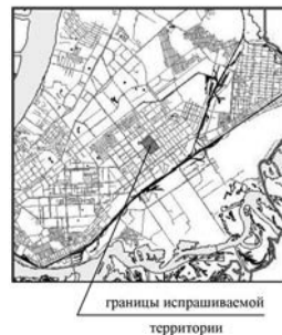
границы испрашиваемой территории