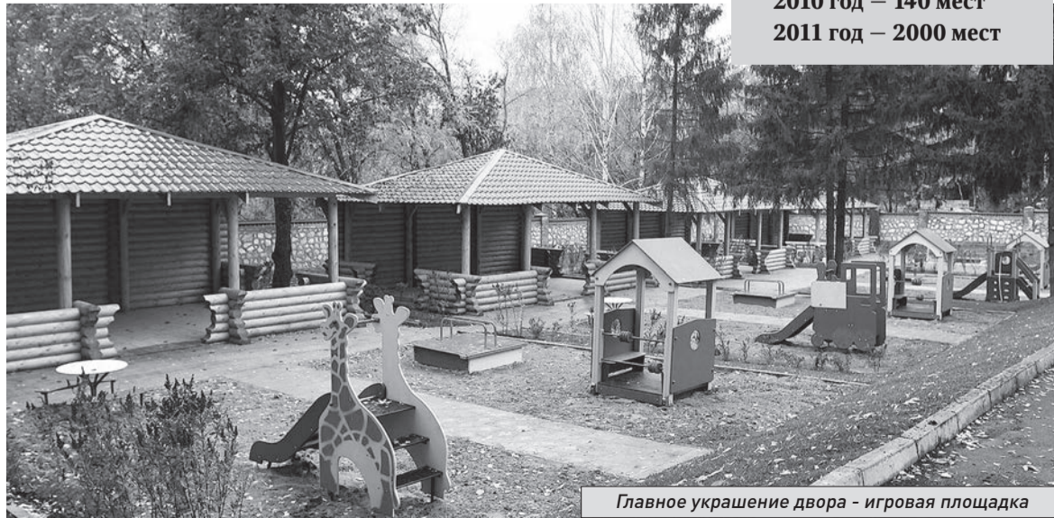
Главное украшение двора - игровая площадка

2008 год — 760 мест 2009 год — 340 мест 2010 год — 140 мест 2011 год — 2000 мест