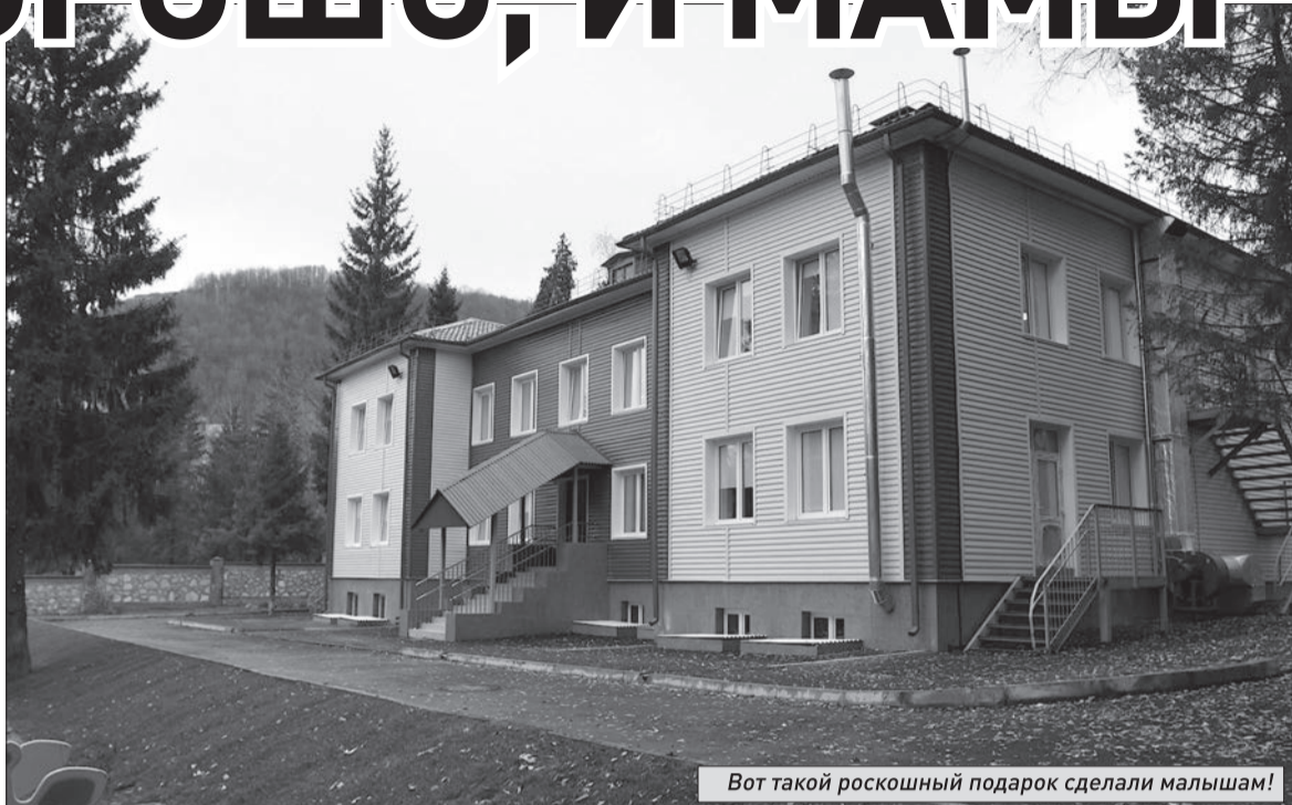
Вот такой роскошный подарок сделали малышам!