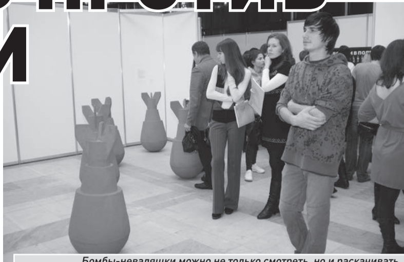
Бомбы-неваляшки можно не только смотреть, но и раскатывать