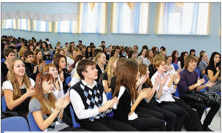
Школьники поддержали идею профилактических визитов в наркодиспансеры