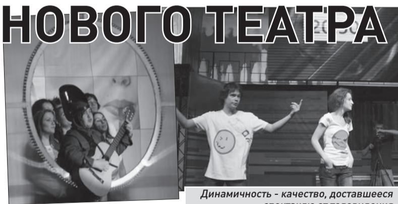
Динамичность - качество, доставшееся спектаклю от телевидения