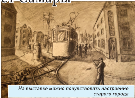
На выставке можно почувствовать настроение старого города

Графические листы, размещенные в двух залах, посвящены вчерашнему и сегодняшнему дню нашего города. На них известные улицы и площади Самары, хорошо знакомые всем достопримечательности. Но больше всего – камерных видов самарских дворишек, улочек и подворотен, которые отображают уникальный облик исторического центра. Основное их достоинство – тонко переданное настроение, поэтичность и лиризм образов. Необычные ракурсы узнаваемых с первого взгляда архитектурных памятников добавляют свежести привычным видам Самары. Богатство и разнообразие пластических мотивов свидетельствует о серьезной натурной работе. Хотя часть графики и создавалась