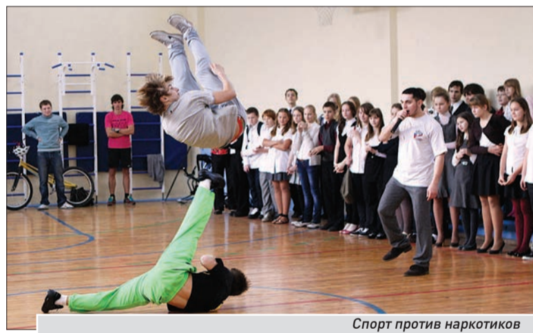
Спорт против наркотиков