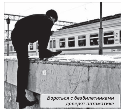
Бороться с безбилетниками доверят автоматике

- Но в Самарской области взвинчивать цены на проезд никто не собирается, - за-