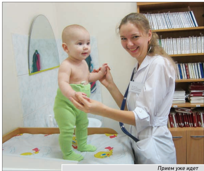
Прием уже идет

- Мы вынуждены работать на абсолютно устаревшем оборудовании, которое к тому же посто-