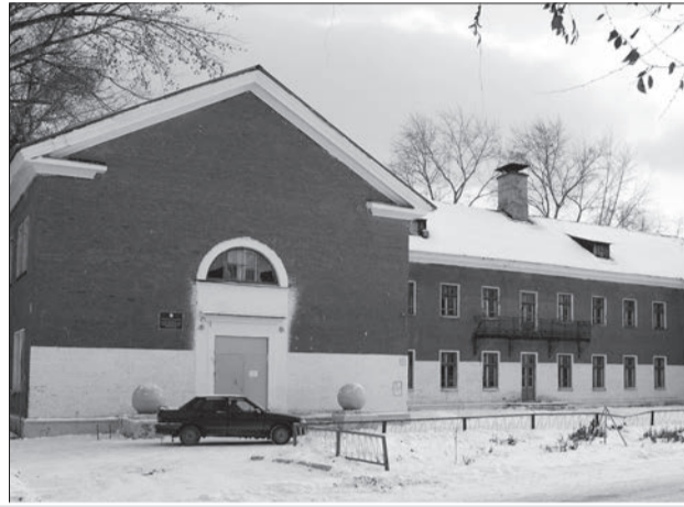
Вместо аварийных корпусов школ №№ 126 и 89 появится современное здание

Аварийное строение снесут, а на его месте появится современное здание. Здесь будут заниматься и ученики соседней школы № 126, классы которой два года закрыты на ремонт.