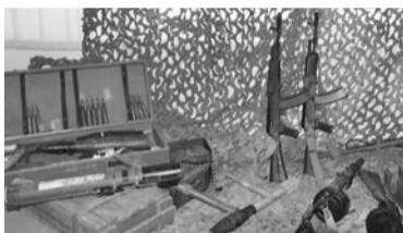
ФОТО → 1. В день памяти героя в школе №64 показали фильм о жизни и военной службе майора Виталия Талабаева. 2-3. В военный музей школы №64 были переданы экспонаты времен афганской войны.

общественных организаций не раз отмечали, что имя Виталия Талабаева увековечено на памятник выпускникам Екатеринбургского суворовского военного училища, погибшим при выполнении служебного и интернационального долга. Самарская школа №64 тоже гордится тем, что носит имя Героя.