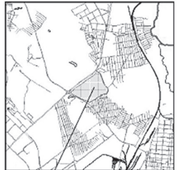
границы испрашиваемой территории