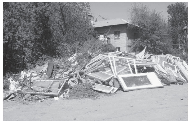
Улица Авроры, 15. Куча строительного и бытового мусора мешала жильцам и двор совершенно не украшала. Теперь мусор убрали и территорию привели в порядок.