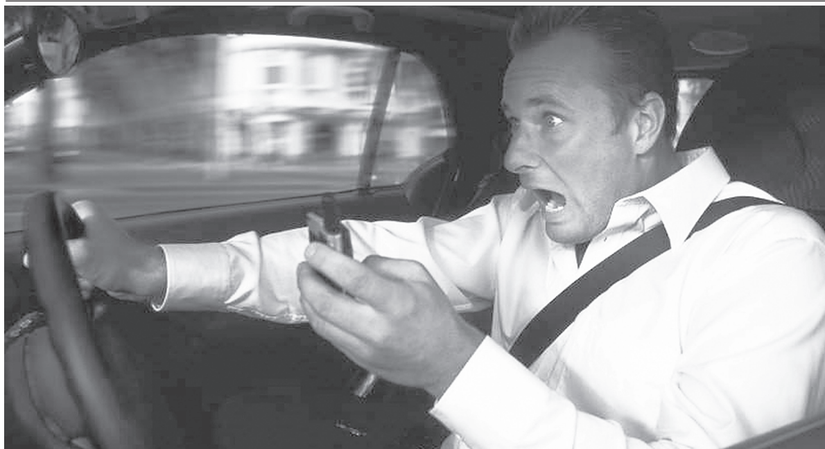
БЕЗОПАСНОСТЬ За семь месяцев - 57 ДТП с участием начинающих водителей