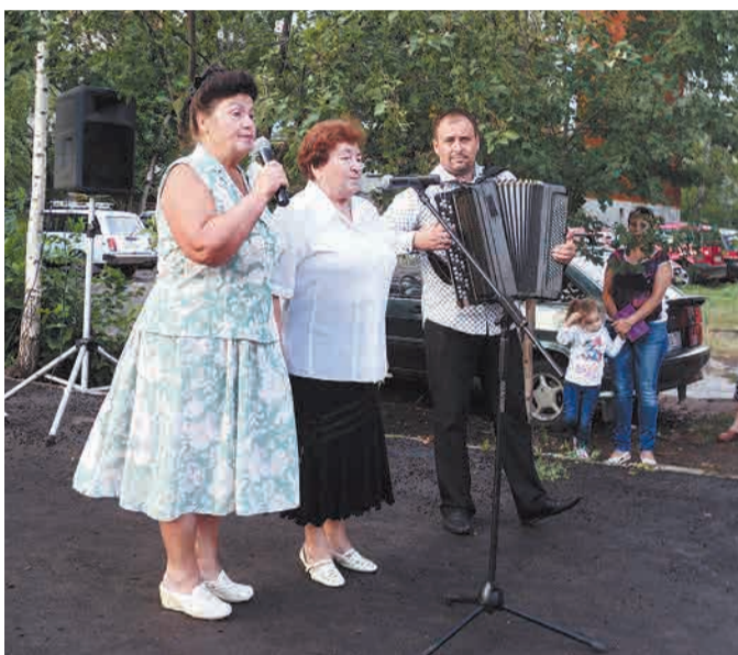
ФОТО → Продемонстрировать свои таланты пришли почти 30 жителей поселка. Среди них и дети, и взрослые.