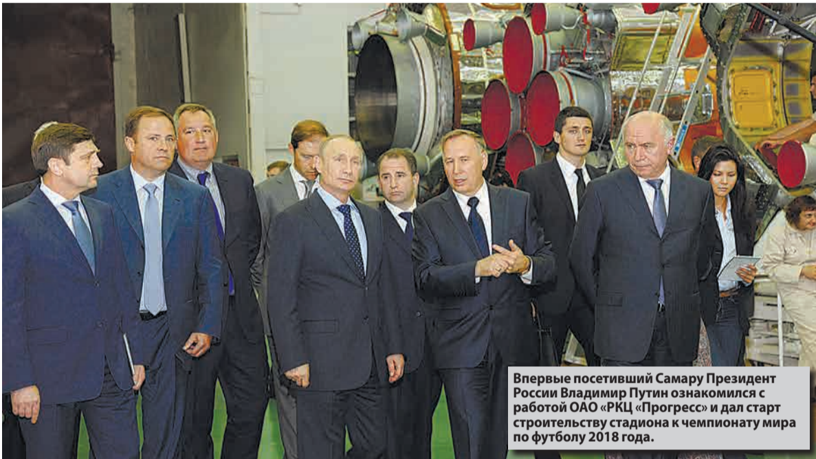
Впервые посетивший Самару Президент России Владимир Путин ознакомился с работой ОАО «РКЦ «Прогресс» и дал старт строительству стадиона к чемпионату мира по футболу 2018 года.