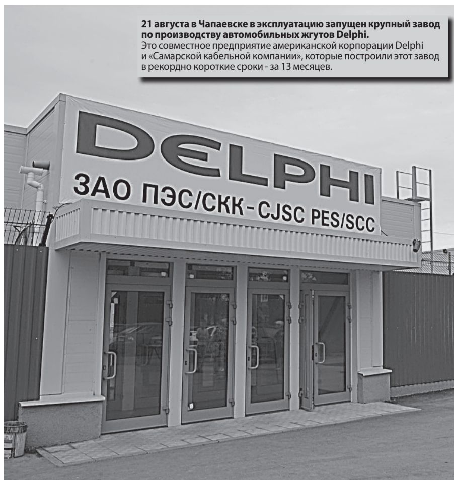
21 августа в Чапаевске в эксплуатацию запущен крупный завод по производству автомобильных жгутов Delphi. Это совместное предприятие американской корпорации Delphi и «Самарской кабельной компании», которые построили этот завод в рекордно короткие сроки - за 13 месяцев.

совещания, самарское авиастроение, судя по всему, получает второе рождение. И не только оно. В поле зрения, обсуждения и принятия решений по федеральной поддержке - аэрокосмический кластер, нефтехимия, автомобилестроение, жилищное строительство, среднее и малое предпринимательство, развитие научного потенциала, огромный круг вопросов развития транспортной инфраструктуры, экологии.