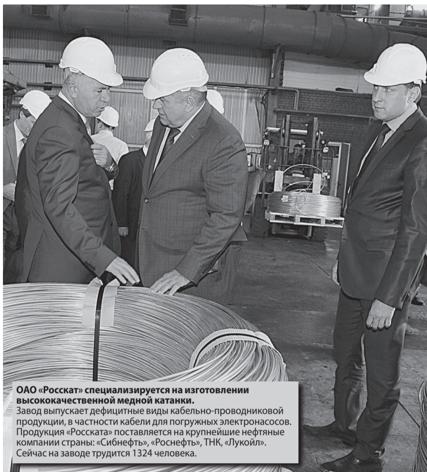
ОАО «Роскат» специализируется на изготовлении высококачественной медной катанки. Завод выпускает дефицитные виды кабельно-проводниковой продукции, в частности кабели для погружных электронасосов. Продукция «Роската» поставляется на крупнейшие нефтяные компании страны: «Сибнефть», «Роснефть», ТНК, «Лукойл». Сейчас на заводе трудится 1324 человека.