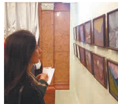
Выставка продлится до 23 февраля. Художественный музей, ул. Куйбышева, 92.

Большую часть выставки составляют картины, созданные по мотивам путешествий Рериха по России, Монголии, Индии, Тибету. Все они относятся к позднему периоду творчества живописца. Лейтмотив его произведений - горные пейзажи, поражающие не только своей нездешней красотой, но и философским спокойствием и умиротворением. Человеческая жизнь - ничто в сравнении с вечными исполинскими вершинами. Здесь мы встречаем сложную симфонию красок, где переплетаются теплые и холодные тона. Композиционный центр картины выделен цветом. Цвет у Рериха вообще приобретает символическое значение. Он писал: «Через цвет звучит приказ будущего. Каждый должен подумать о ярких блестящих оттенках, которые всегда знаменуют эпоху возрождения».